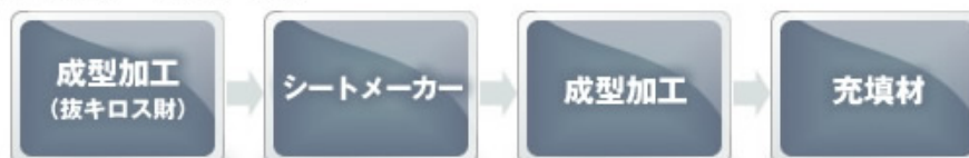
冷却塔充填材(クーリングタワー充填材)

当社は、上記モデルのコーディネートを行い、リサイクル環境社会の一役を担っております。