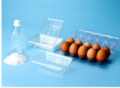
PETフレーク・PETボトル・葎パック・卵パック(納入切)

各自治体より回収したPETボトルを粉碎・洗浄したフレーク品を認定事業者より仕入、リサイクル環境社会に尽力しております。